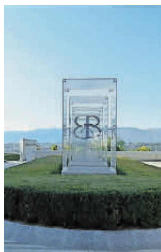
Biblioteca Bodmeriana Cologne

Visitori e ricercatori fanno parte del pubblico della Fondazione Biblioteca e Museo Bodmer di Cologne, a due passi dal centro di Ginevra. Ma è un Museo o una Biblioteca? «Tutte e due. Infatti degli oltre 150 mila documenti conservati circa 50 mila hanno raggiunto un carattere museale, per rarità e qualità di conservazione». Ci accoglie e ci guida fra le sale della Biblioteca il vicedirettore della Fondazione, Nicolas Ducimetière che sottolinea: «quando Martin Bodmer decise di creare una biblioteca, voleva soprattutto aiutare la ricerca». Animato da un'eccezionale passione bibliofila, Bodmer (Zurigo, 1899 - Ginevra, 1971) ha iniziato giovanissimo a collezionare libri fino a farne diventare una delle più importanti raccolte private al mondo di papiri, manoscritti, incunaboli, libri antichi, copie rare e prestigiose di opere di autori della Letteratura, delle Religioni,