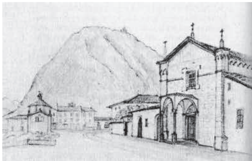
FASCINAZIONE CULTURALE A sinistra: «Lugano, Chiesa della Madonna degli Angeli» in uno schizzo a matita di Jacob Burckhardt; a destra lo studioso poco più che ventenne in una foto scattata intorno al 1840.

Senza dubbio, i numerosi viaggi verso l'Italia, condotti a più riprese fin da quando aveva circa vent'anni, influenzarono notevolmente la sua percezione dell'arte e il suo gusto estetico, tanto che Burckhardt, in più occasioni, espresse tutta la sua ammirazione verso la città di Firenze e verso alcuni dei più grandi artisti rinascimentali italiani, quali - ad esempio - Leonardo e Raffaello. L'incontro con l'Italia, però, avvenne in un certo senso per gradi e molto probabilmente con la mediazione - se così si può dire - del Canton Ticino e dei paesi sulle rive del Verbano, visitati per la prima volta nell'estate del 1837, quando ancora era uno studente di teologia a Basilea. Nonostante le difficoltà date dalla lingua e da esperienze non sempre positive con le autorità locali, Burckhardt imparò presto - e con lui i suoi compagni di avventura - ad apprezzare non solo le bellezze artistiche e le tradizioni locali (pure quelle gastronomiche), ma anche e soprattutto il paesaggio di questa «Italia» così diversa - culturalmente, climaticamente e morfologicamente - dai territori nordici nei quali era cresciuto. Seppur breve (il primo soggiorno durò solo cinque giorni), l'impatto fu tal-